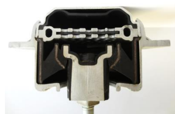
Hydraulisch dämpfendes Elastomerlager

Aus vorausgegangen Arbeiten wurden aus den Messdaten bereits erste Kenngrößen generiert. Diese Kenngrößen sollen durch das Betrachten weiterer Lastfälle sinnvoll erweitert und ergänzt werden.